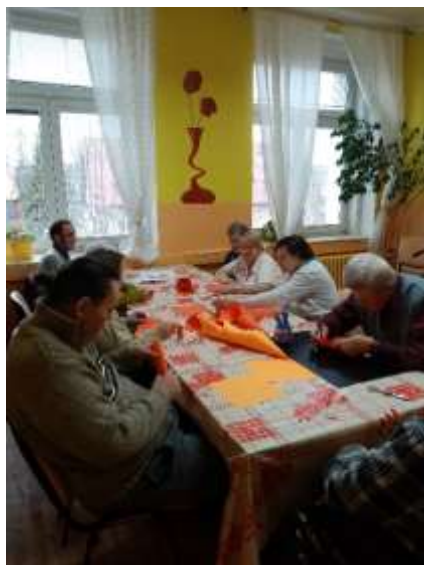
Výroba výzdoby s klienty