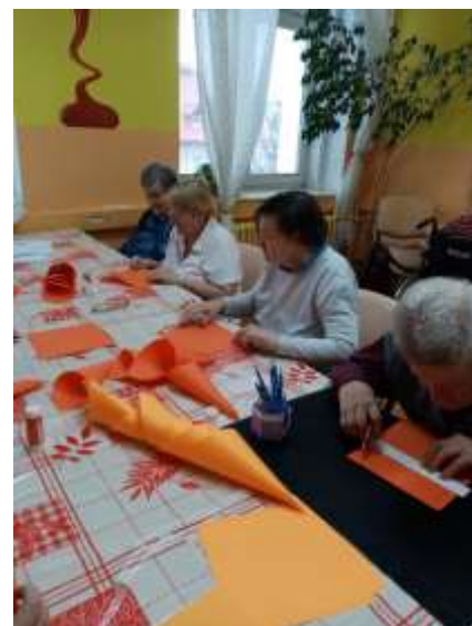
Oslava MDŽ na domově